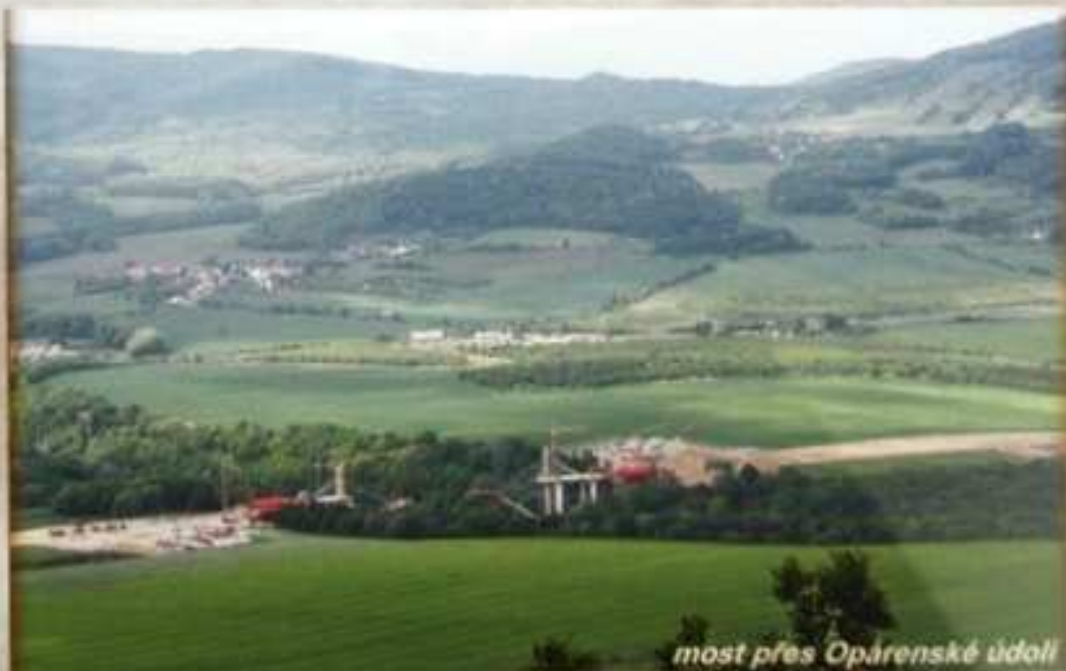
most přes Opárenské údolí

Součástí stavby jsou 3 MUK, 19 dálničních mostů, 9 nadjezdů, rozšíření stávajícího mostu, z toho 19 dálničních, 9 nadjezdů a 1 ostatní, 2 tunely, tunel Prackovice (260 m) a tunel Radešín (620 m). Dále budou zhotoveny přeložky silnic (7284 m), 18 přeložek polních a lesních cest (10167 m), 4 přeložky plynovodu (3,2 km), 9 protihlukových stěn (6070 m) a SOS systém. Celkový objem výkopů je 1,555 mil. m 3 a násypů je 1,607 mil. m 3 . Dálnice vede přes CHKO České středohoří, kde je vybavena nadstandardními ekologickými opatřeními, které dosahují celkové hodnoty 1 miliardy Kč.