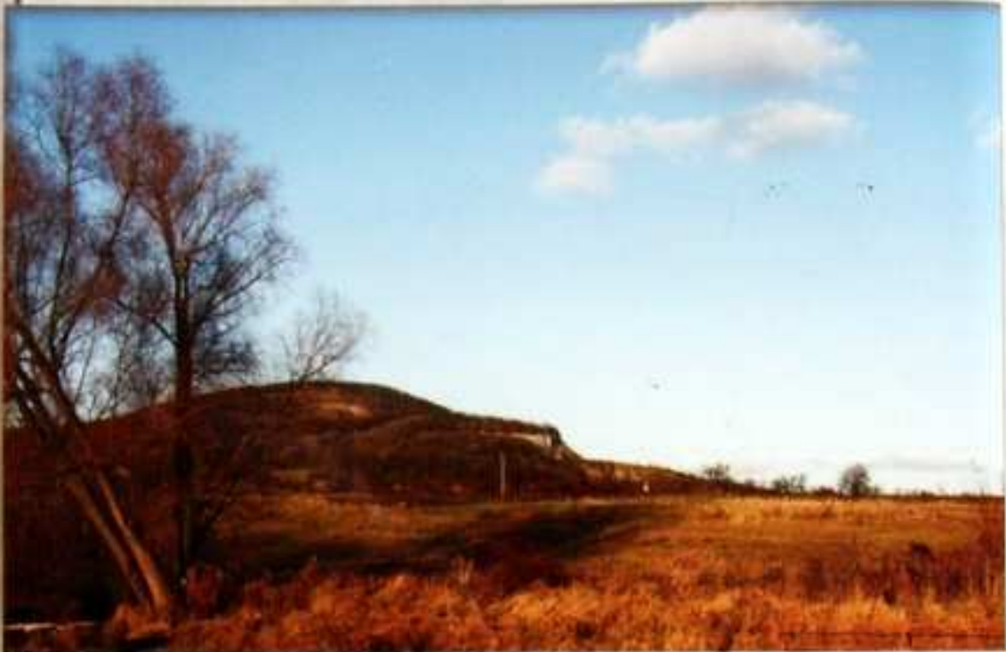
LOM - v katastru obce se nacházel závod Severočeského průmyslu kamene v Dobkovičkách.