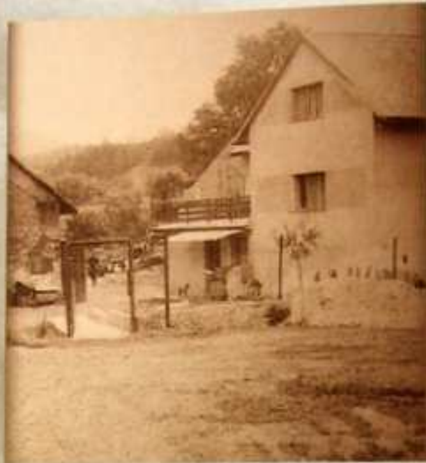
Oprava komunikace u Šafránků.