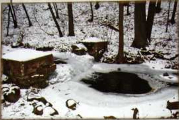
Opárenské údolí v zimě.