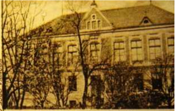
Kottoměř - Chotiměř