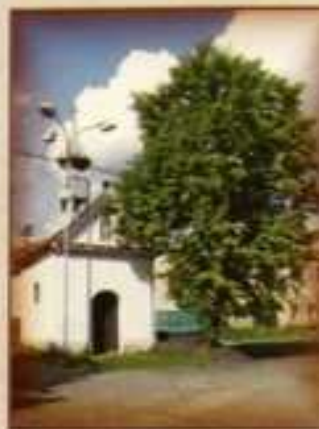
Tuto podobu dostala kaplička po opravě v roce 1968. Další nutnou opravou prošla kaplička v r.1991