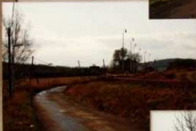
R.2001 oprava silnice k nádraží.