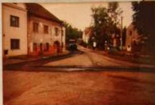
Oprava komunikace od křižovatky ke kapličce.