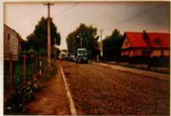
Česká ulice r.2003