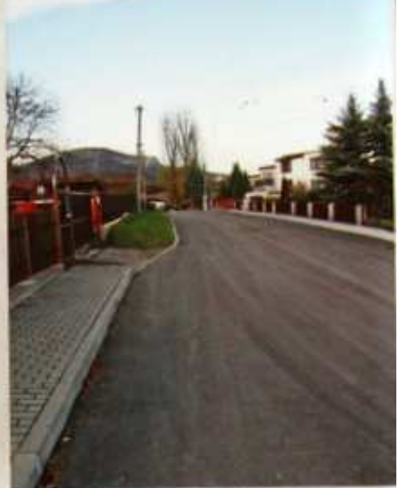
V roce 2006 byla vybudována horská vpust' přes silnici vedoucí k požární nádrži, chodníky a komunikace .