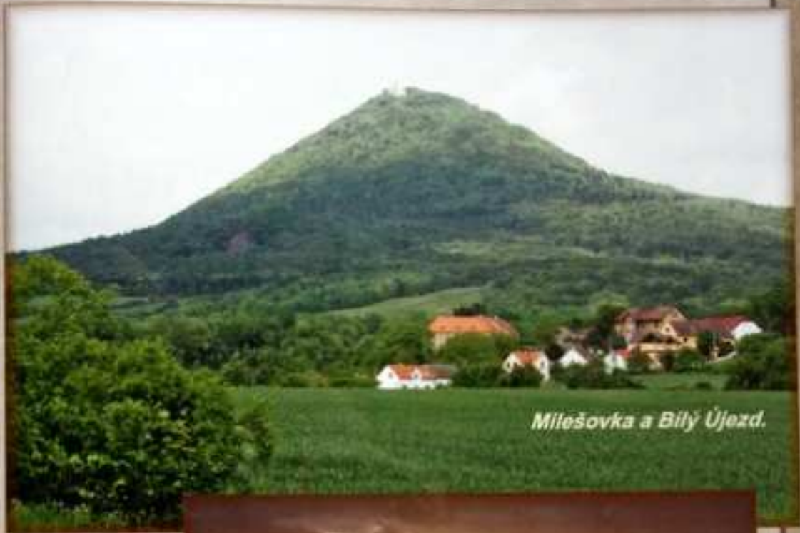
Milešovka a Bílý Újezd.