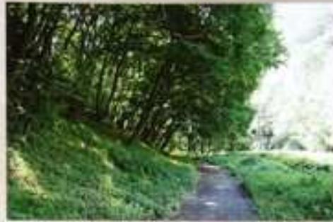
Opárenské údolí v létě.