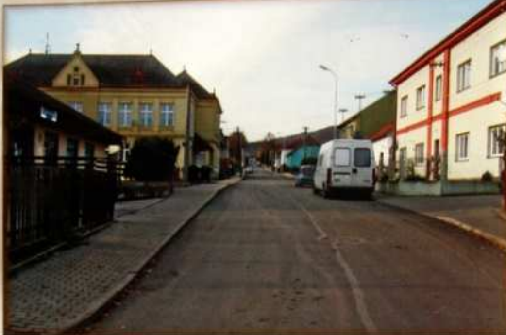
Česká ulice r.2009