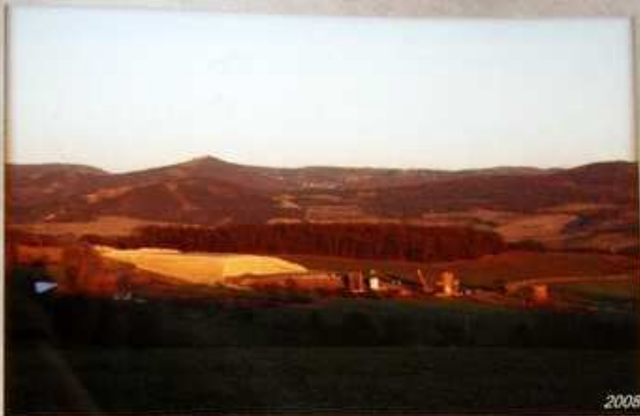
V rámci výstavby části dálnice D8 přes České středohoří nechalo ŘSD opravit komunikaci vedoucí z Velemína do Dobkoviček.