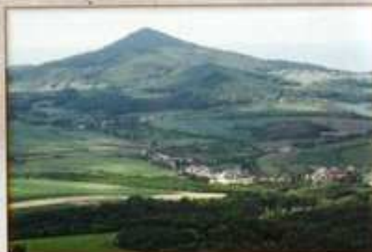
Chotiměř v pozadí s Kletečnou.