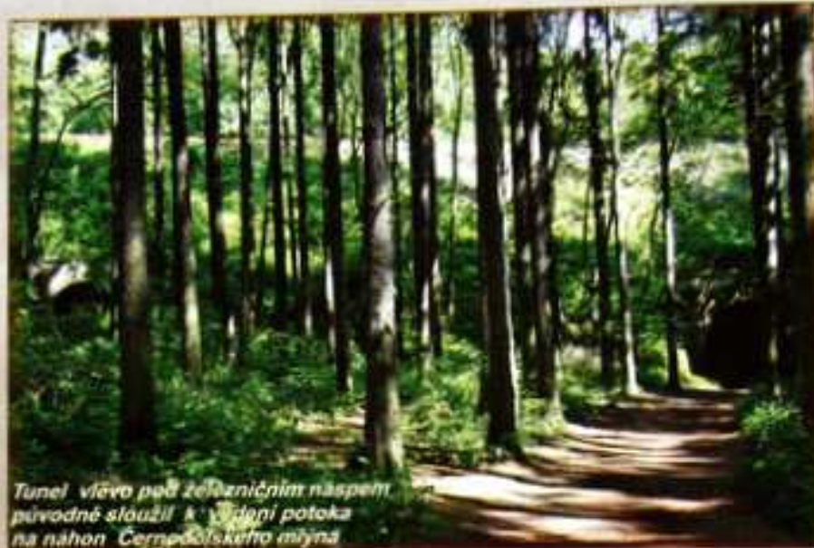
Tunel vlevo pod železničním náspem původně sloužil k výdři potoka na náhon Černošského míjna

Opárenské údolí vzniklo ve starohorách a prvohorách z přírodnin jako je rula, ortorula a migmatit. Ve zbytcích přirozených olšin můžeme na jaře obdivovat nápadné květy pryskyřníků, sasanečků, dymnivek a lechy. V nivě potoka kvetou plicník lékařský, pižmovka mošusová a devětsíň lékařská. V doubravě, vyskytující se typicky na jihozápadě Českého středohoří, naleznete z chráněných rostlin medovňák meduňkolistý, lilii zlatohlávek a vemeník dvoulistý. Nejvíce zde roste jasan ztepilý. V Milešovském potoce se prohánějí pstruhové potoční, na březích běhají mlouci skvrnití a hnízdí zde konipas horský a střízlík obecný. Touto spodní částí údolí prochází Naučná stezka Lovoš, která seznamuje s místními přírodními zajímavostmi. V roce 2004 byla vybudována cyklostezka v rámci sdružení Integro, na trase Opárno, Velemin, Chotiměř. Část cyklostezky byla převedena do majetku obce Velemin.