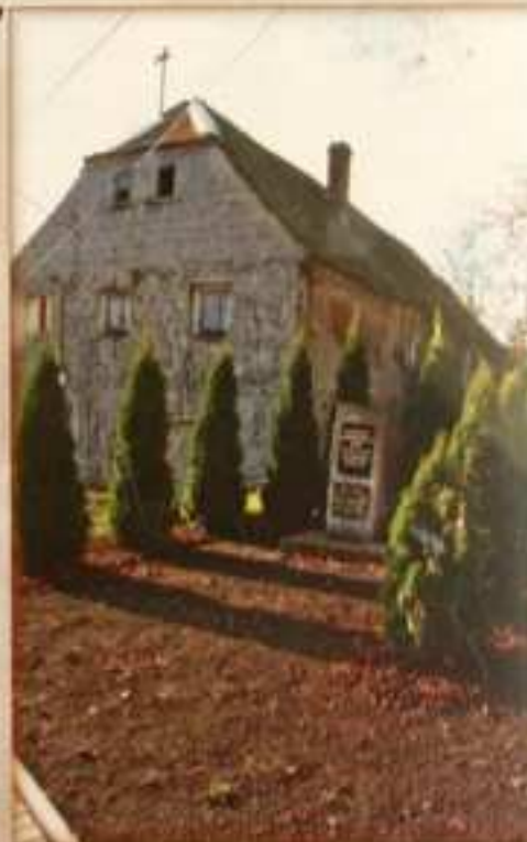
Pomník věnovaný obětem války