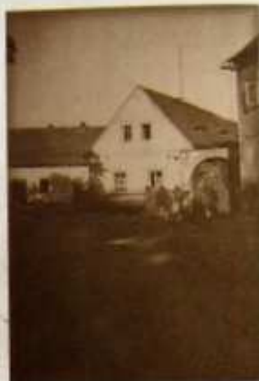
Pár dochovalých snímků z neurčeného roku a jejich podoba dnes v roce 2009.