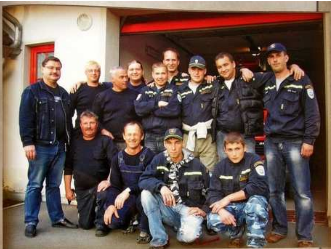
V roce 1993 byla vystavěna nová požární zbrojnice. Roku 1997 byl založen spolek hasičů „Jednotka požární ochrany stupně V a od roku 1999, je zařazena do kategorie jednotek stupně III.