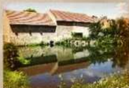
Rok 2007 - fy Narcis-výsadba stromů okolo rybníka u požární zbrojnice.