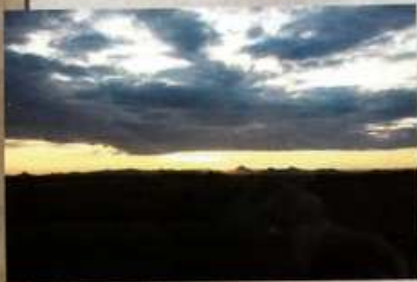
České středohoří - pohled od Roudnice n.L.