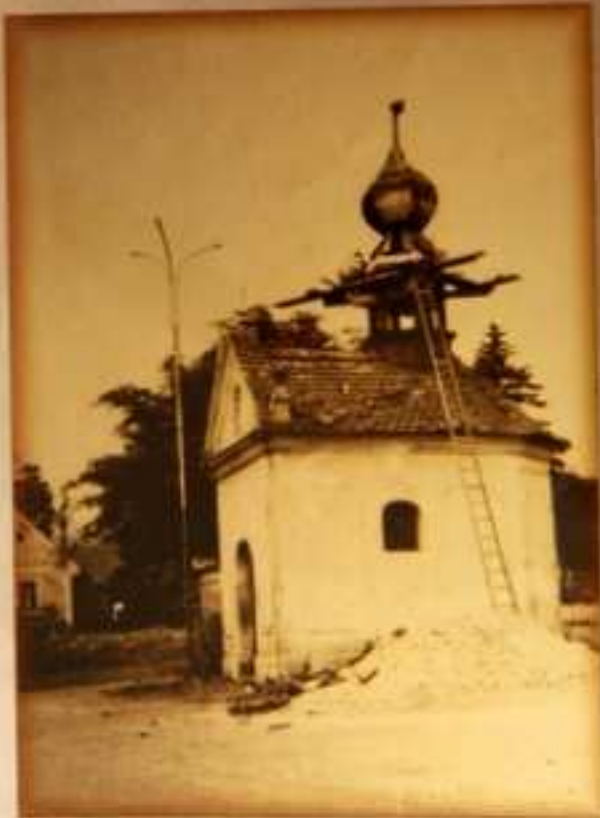
16.7.1968 oprava kapličky MNV a vysázení lípy svobody