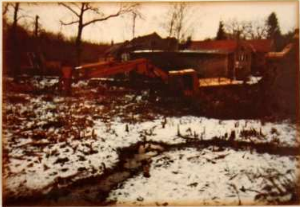
Rybník u požární zbrojnice