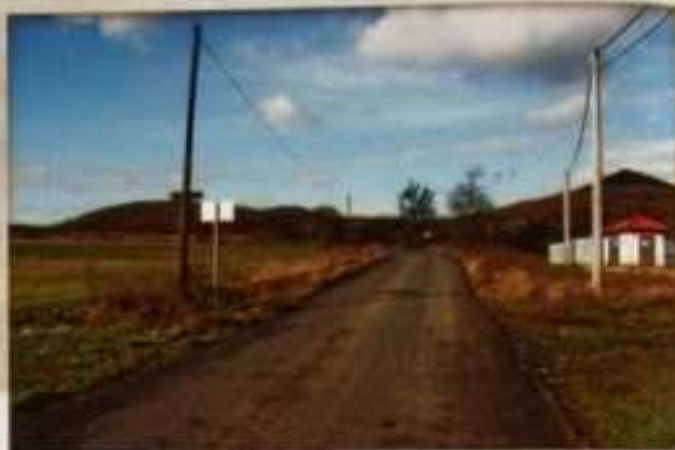
R.1999 oprava silnice na Hrušovku.