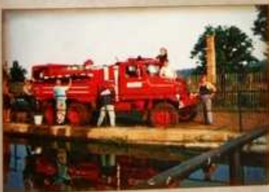
Od r.2000 jezdí jednotka na zásahy. Její první výjezd byl k ohni do sousedních Dobkoviček, kde v rodinném domě vybuchla plynová bomba.