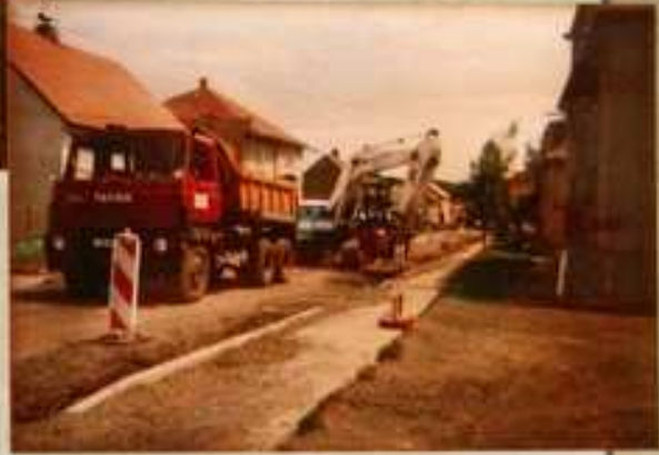
Česká ulice r. 2003