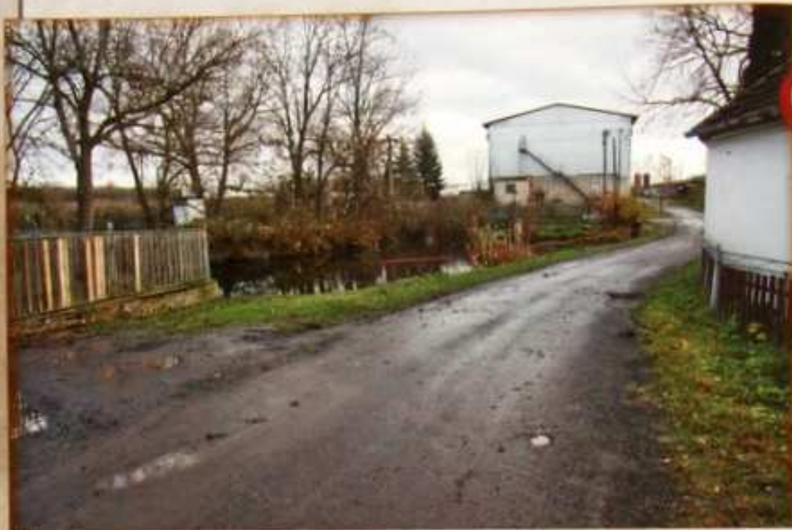
Rybník u Kasalů naposledy byl čištěn roku 1997.