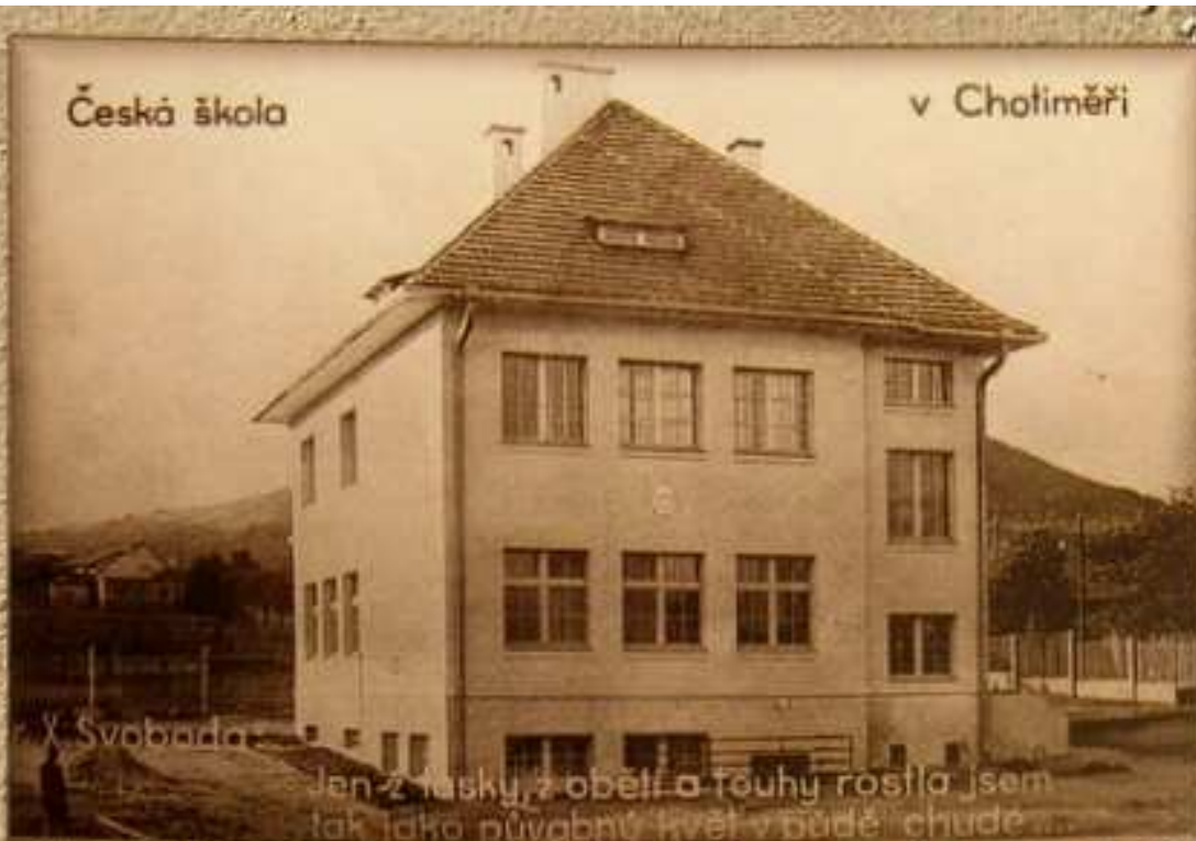
Budova dnešní MŠ byla postavena v roce 1937. Původně zde byla česká menšinová škola a od roku 1945, mateřská škola.