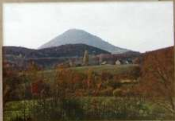
Milešovka a domy na Hrušovce, spadající do katastru Chotiměř