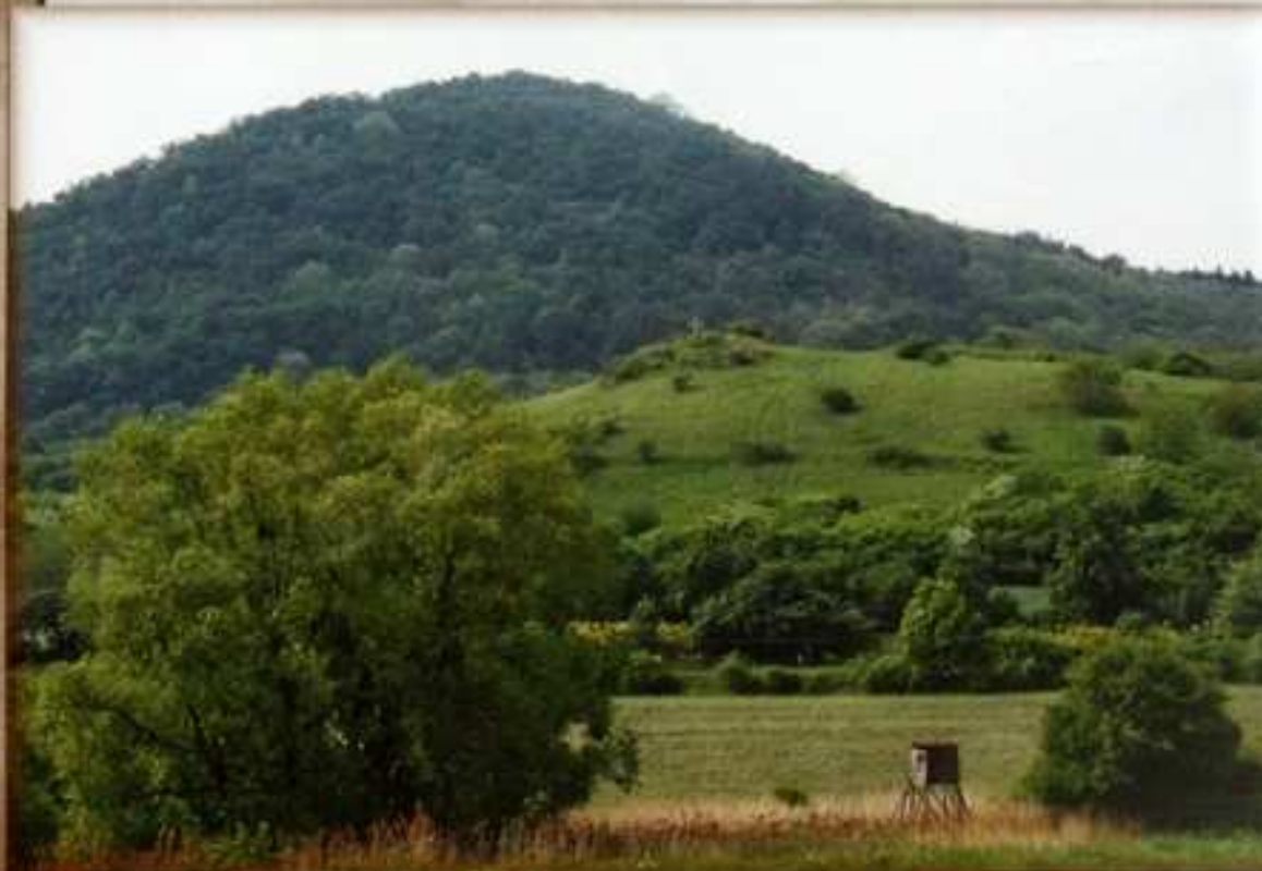
Ještě v r.1920 byla v Chotiměři pěstována vinná réva na 10-ti arech na vrchu zvaném "Košinka".