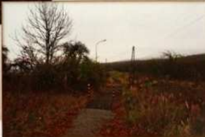
R.2006 byla cesta pro pěší k nádraží osázena javory kleny. Roku 2007 obec nechala cestu zpevnit asfaltovým výfrezkem a vybudovat zábrany aby na cestu nemohla vjíždět větší vozidla.