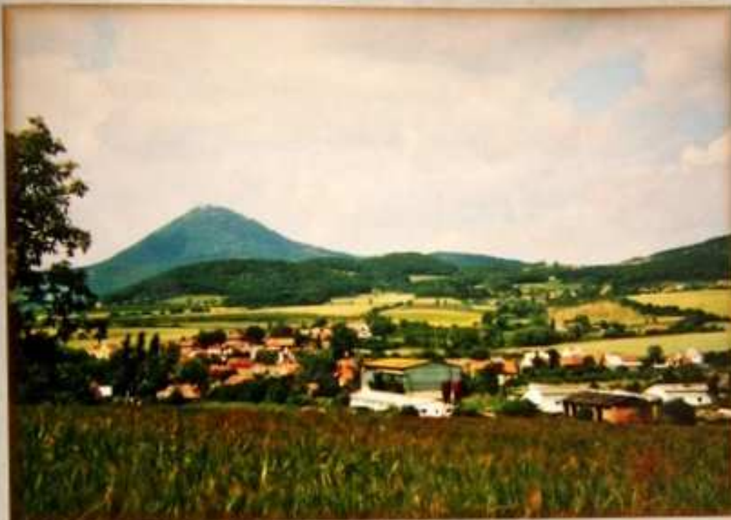
Při silnici do Dobkoviček je stará část obce, převážně zemědělské usedlosti, která bývala do r. 1945 německá a druhá část obce, tzv. Česká ulice, při cestě na Hrušovku se skládá převážně z rodinných domků. Češi zde před druhou světovou válku tvořili početnou menšinu.