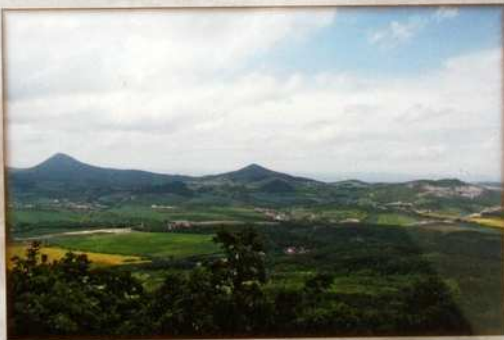
Milešovka, Kletečná a Kubačka - lom Dobkovičky. Pohled z vyhlídky Lovoše.