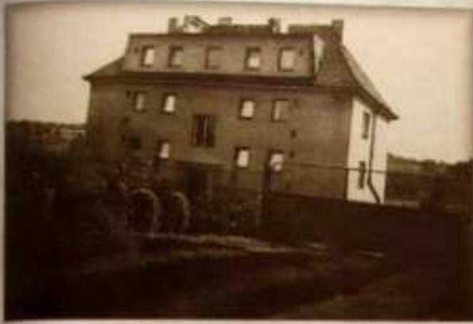
V rámci stabilizační výstavby místního JZD byl během let 1967-1968 vybudován nový nájemní dům o 6-ti bytových jednotkách čp.97. V letech 1970-1972 druhý čp.99.